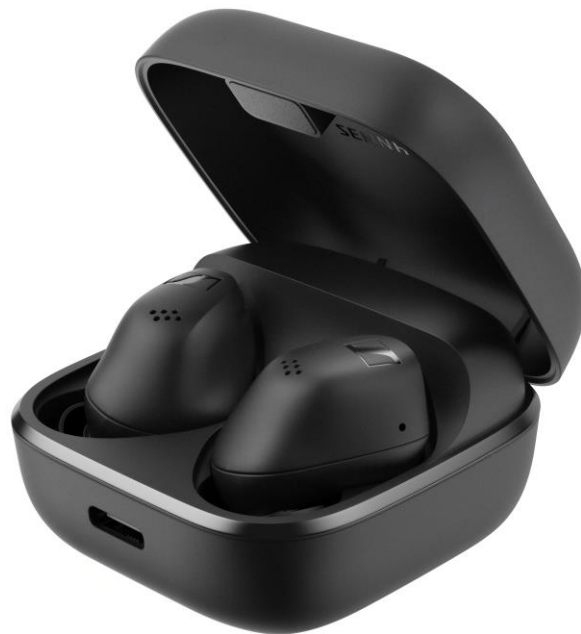
图片：ACCENTUM 真无线在紧凑的 Qi 充电盒中

当与波束成形话筒阵列结合使用时， ANC 可将低频干扰降低到耳语般的程度，能迅速消除飞机机舱噪音、电器嗡嗡作响的声音、附近交通噪音和熙熙攘攘的咖啡店杂音。 ACCENTUM 真无线耳机的混合 ANC 和透明聆听模式可以让佩戴者通过简单的点击手势或 Sennheiser Smart Control 应用程序按需聆听周围环境的聲音，从而轻松应对干扰。通过该应用程序，用户可以选择不同的透明程度，同时使用 5 段均衡器和声音测试进一步定制声音。声音测试是一种引导式预设创建器，用户可以将其上传到云端，并在所有 iOS 或 Android 设备上使用。均衡器定制只是一个开始，用户还可以通过自定义触摸控制来管理媒体、通话和语音助手。