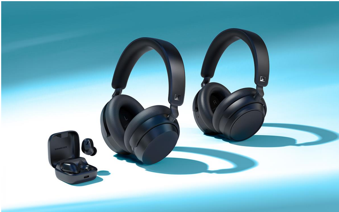
图片：完整的系列（从左到右）：ACCENTUM 真无线、ACCENTUM 无线和 ACCENTUM Plus 无线

ACCENTUM 真无线耳机将提供黑白两种配色供消费者选择，并将于 5 月正式上市。更多详情请访问指定零售商和森海塞尔官网 sennheiser-hearing.com 。